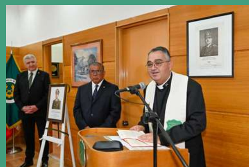
Imágenes de la Ceremonia de Reinauguración de la sede del Cuerpo de Generales de Carabineros, año 2025